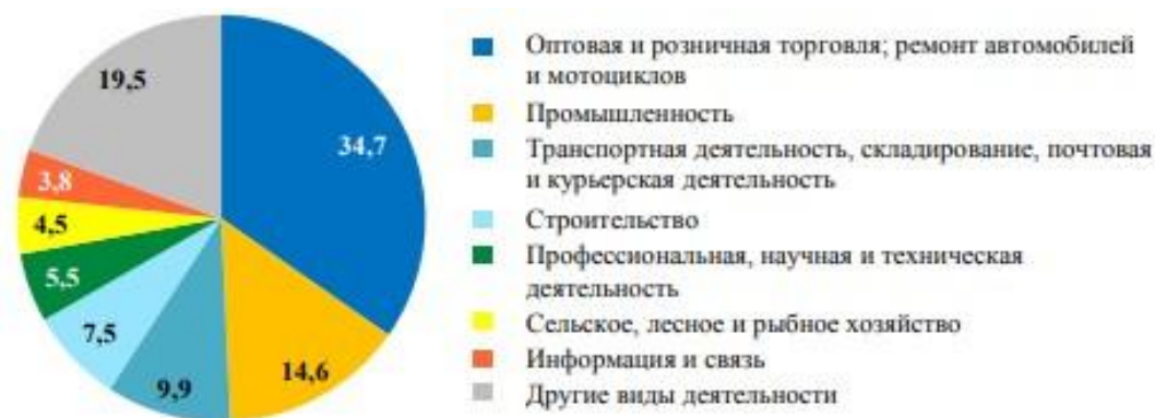
Рисунок 2.1. – Удельный вес активных предприятий по видам экономической деятельности в 2021 году

Проведем анализ активных предприятий по видам экономической деятельности за 2021-2022 гг.