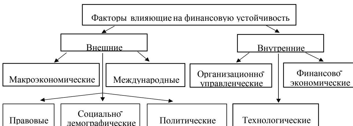
Рисунок 1 – Внешние и внутренние факторы, влияющие на финансовую устойчивость кредитной организации

Без учета мобильности и срочности активов и пассивов, определяющих способность конвертировать краткосрочные ресурсы в долгосрочные инвестиции, банки могут нести риск потери ликвидности. Взаимосвязанные банковские риски могут вызвать риск неплатежеспособности (риск, связанный с капиталом и прибылью). Состав факторов представлен на рисунке 1.